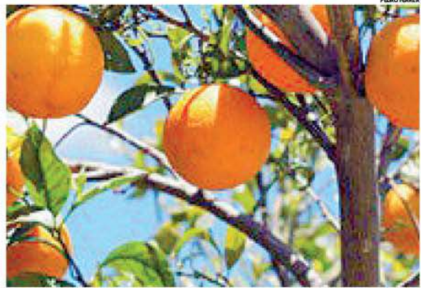
Itaboraí, Tanguá ou Araruama? Três municípios fluminenses "brigam" pela laranja.

No final de agosto, o plenário da Alerj aprovou conceder a Itaboraí o título de "Terra da Laranja", proposto pelo deputado Guilherme Delaroli. A cidade de Itaboraí até os anos 80 era considerada o segundo maior produtor da fruta no país. Com solo rico em nutrientes, chegou a ser conhecida como a "seleta mais doce do Brasil". Em março de 2022, o governador Claudio Castro já havia reconhecido o município de Tanguá como a Capital Estadual da Laranja. Segundo últimos dados da Emater-Rio, Tanguá é responsável por 18.585 toneladas, e Itaboraí alcançou apenas 2.577. O hino oficial de Itaboraí faz menção aos laranjais, e um logotipo usado por Tanguá estampa a metade da fruta. Mas o fato é que a maior produtora de laranjas do estado do Rio é Araruama.