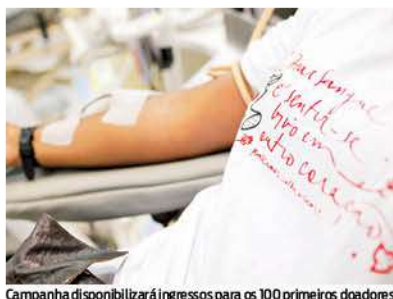
Campanha disponibilizará ingressos para os 100 primeiros doadores

Para doar sangue, é preciso ter entre 16 e 69 anos, pesar no mínimo 50 kg, estar bem de saúde e portar um documento de identidade oficial com foto. Jovens